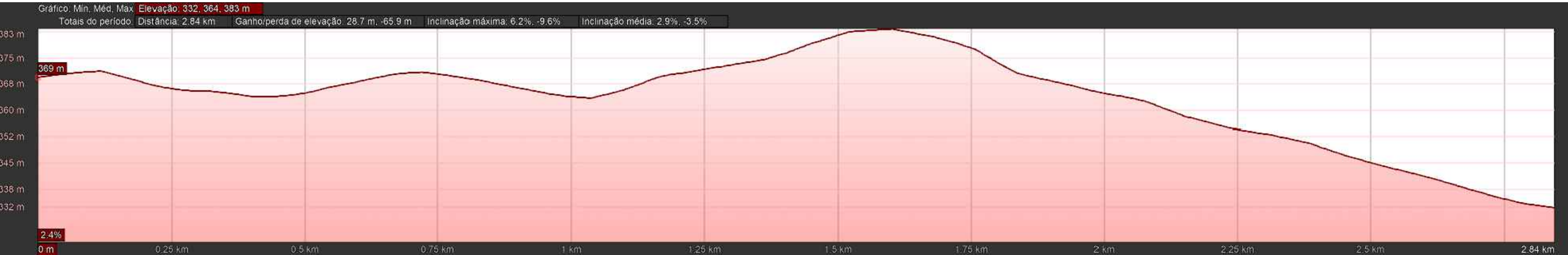
PERFIL TRECHO 02 ESC. S/ ESCALA